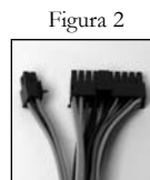
Motherboard con 20 pin