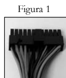
Motherboard con 24 pin