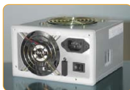
Dichtungen bei Lüfter und Netzteil.