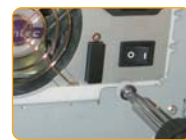
Schrauben mit Unterlegscheiben.

www.antec-inc.com • 1-800-22ANTEC • +31 (10) 462-2060